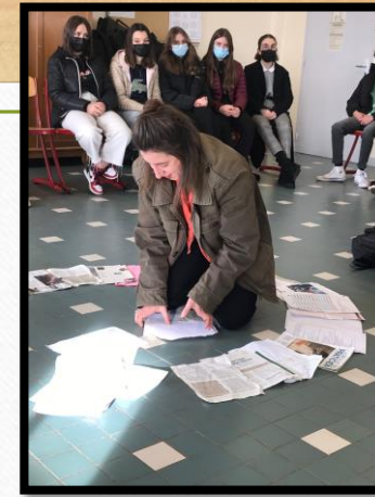
La comédienne traçant son cercle de journaux lors de la troisième représentation

Selon nous, cette première phase du dispositif « Apprentis et lycéens au spectacle vivant » a été très intéressante et enrichissante, et ce pour plusieurs raisons :