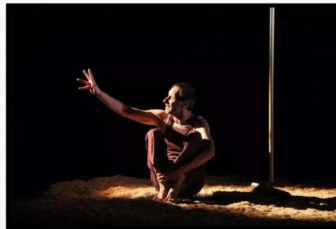
Le comédien en jeu durant la pièce