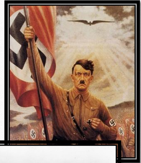
Affiche de propagande du IIIème Reich montrant Hitler