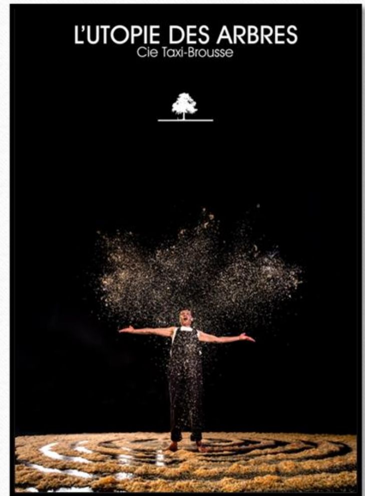
L'affiche du spectacle

Nous avons également étudié l'affiche de la pièce qui nous fournit quelques indices sur la représentation. Sur celle-ci figure le nom de la compagnie qui a créé la pièce : la compagnie Taxi Brousse basée à Quetigny. Sur l'illustration, on peut voir un comédien qui se tient debout, les bras écartés. Sa posture ainsi que son expression faciale peuvent nous laisser croire qu'il est en admiration devant quelque chose, ou tout simplement heureux. Il est surmonté qu'un nuage formé par une sorte de poudre jaune. Cette poudre est aussi présente sur le sol, où elle est disposée en forme de spirale. L'homme se tien au milieu de cette spirale. Dans cette affiche, on retrouve plusieurs éléments qui pourraient faire référence aux arbres dont il est question dans le titre : l'homme surmonté du nuage laisse imaginer la silhouette d'un arbre dont le comédien serait le tronc. Le petit logo d'arbre situé juste au-dessus pourrait être une aide qui nous permet de mieux visualiser la silhouette. Par ailleurs, la spirale formée au sol pourrait très bien représenter les cernes d'un tronc d'arbre.