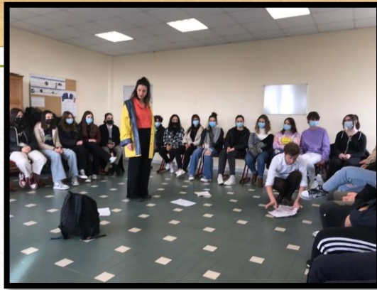
Les comédiens avec leurs nouveaux costumes actualisés