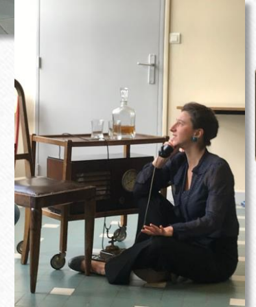
Accessoires et costumes d'époque utilisés pour la première représentation